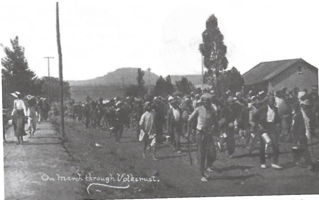
Duisende Indiërs stap in die Groot Optog in 1913 om teen onregverdige wette te protesteer.

Gandhi is gedurende die optog drie keer gearresteer en vrygelaat, maar die mense het aanhou stap. Toe die optoggers deur die polisie aangeval is, het hulle nie teruggeveg nie. Gandhi het samesprekings met die regering gehou. Dit besighede het gesukkel, want daar was nie genoeg werkers nie. Die spesiale belasting is geskrap.